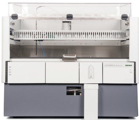
Rys. 4. EUROIMMUN Analyzer I.