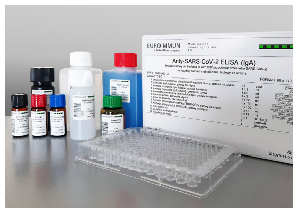
Rys. 3. Zestaw testowy EUROIMMUN Anty-SARS-CoV-2 ELISA (IgA).